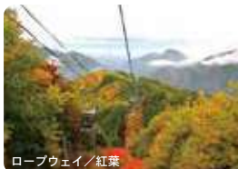
ロープウェイ／紅葉