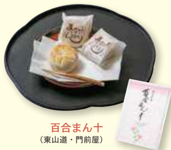
百合まん十 (東山道・門前屋)