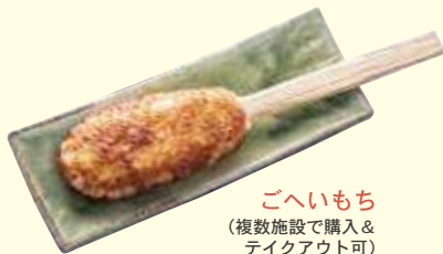
ごへいもち (複数施設で購入& テイクアウト可)