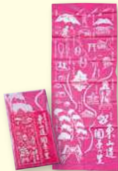
園原の里 オリジナル手ぬぐい ¥1000 (複数施設で購入可)